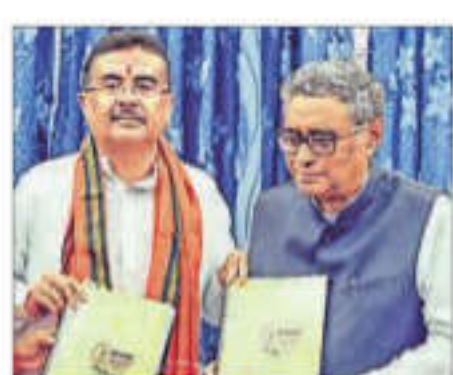
CM Suwendu Adhikari, accompanied by state Finance Minister Swapan Dasgupta (right) at the West Bengal Legislative Assembly House, in Kolkata on Monday

The Eight Core Industries comprise 40.27% of the weight of items included in the Index of Industrial Production (IIP).